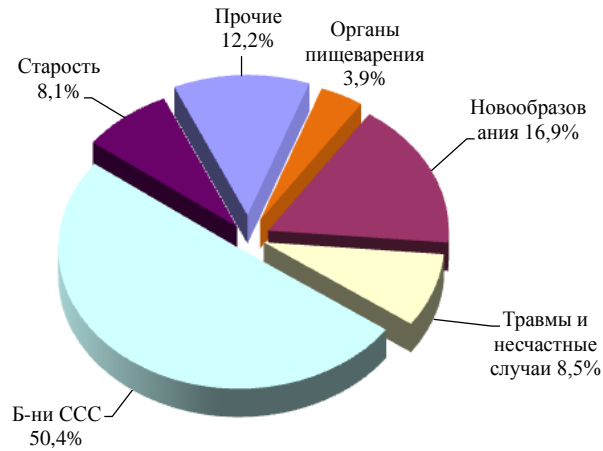
Рис. 8. Структура смертности населения г. Могилева в 2013г.

В структуре смертности болезни системы кровообращения составляют 50,4%, новообразования -16,96%, травмы, отравления и некоторые др. последствия воздействия внешних причин – 8,5%, старость 8,1% (рис. 8).