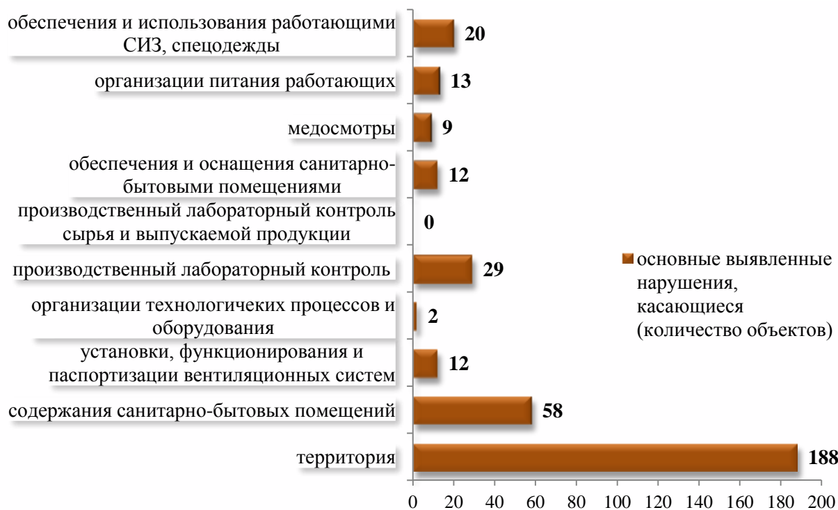
Рисунок 35 – Основные выявленные нарушения на предприятиях г. Могилева в 2017 году

Основными проблемными вопросами на предприятиях г. Могилева остаются: содержание территории промплощадки, содержание в надлежащем состоянии санитарно-бытовых помещений и производственный контроль. Так, в 2017 году нарушения в части содержания территории выявлялись на 54,8% объектов промышленности от общего числа проверенных, а нарушения в части содержание в надлежащем состоянии санитарно-бытовых помещений и производственный контроль 16,9 % и 8,5% соответственно.